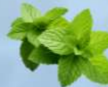
LEVISTICUM OFFICINALE LIVÈCHE