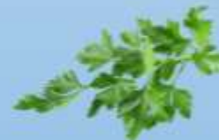
LEVISTICUM OFFICINALE LIVÈCHE